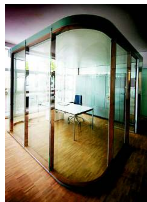
Auch innerhalb eines Raumes kann man sich gegen Bürolärm abschirmen.