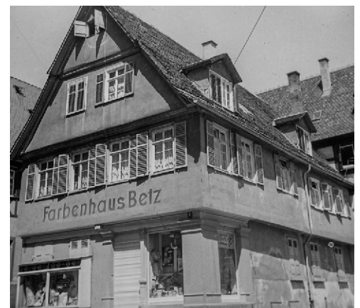
Das Schaufenster des Heimatvereins heute und in der Vergangenheit.